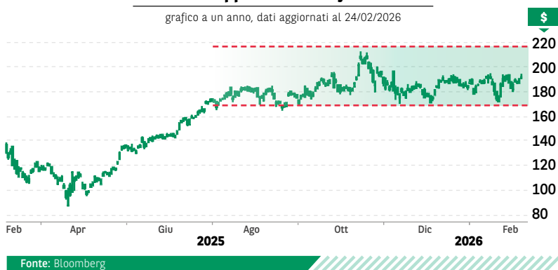
grafico a un anno, dati aggiornati al 24/02/2026